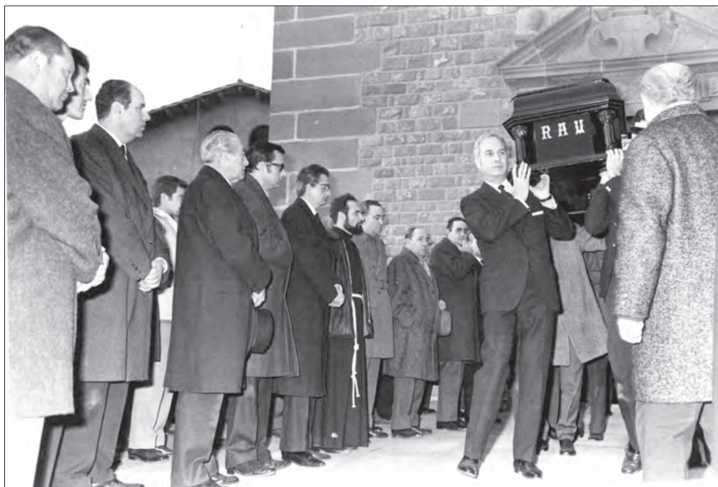
Enterrament de Ramon d'Abadal a Gurb (19 de gener de 1970).