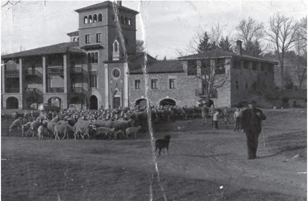
La casa Abadal del Pradell abans de les reformes (1944).