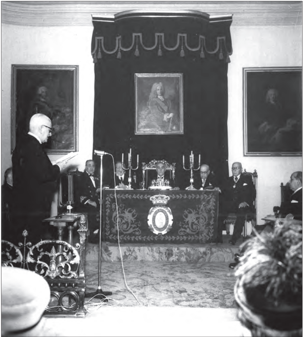
Ingrés de Ramon d'Abadal a l'Acadèmia de la Història (27 de novembre de 1960).