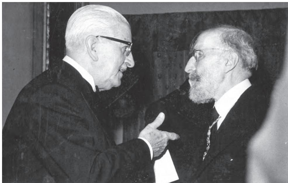
Ramon d'Abadal i Ramon Menéndez Pidal (1960).