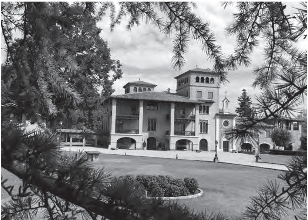
La casa Abadal del Pradell.